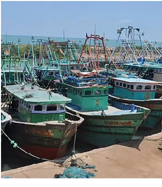
வைக்கப்பட்டுள்ளன. அதே போல் பாம்பன், மண்டபம், தொண்டி, சோழியக்குடி, ஏர்வாடி, கிழக்கரை, முக்கையூர் உள்ளிட்ட மாவட்டம் முழுவதும் சுமார் 2 ஆயிரத்துக்கும் அதிகமான விசைப்பட்டுகள் மீள்பிடிக்க செல்லாமல் ஆங்காங்கே உள்ள துறைமுக கடல் பகுதியில் நங்கூரமிட்டு நிறுத்தி வைக்கப்பட்டுள்ளன. மாவட்டம் முழுவதும் சுமார் 50 ஆயிரத்துக்கும் மேற்பட்ட மீள்வர்களும், அதைசார்ந்த மீள்பிடி தொழிலாளர்களும் வேலைவாய்ப்பை இழந்து உள்ளனர். இந்த மீள்பிடி தடையின் காரணமாக அடுத்த இரண்டு மாதங்களுக்கு ஆழ்கடல் மீள்வரத்து இருக்காது. இதனால் மீள் சந்தைகளில் விற்பனை வரலாறு காணாத உச்சத்தைத் தொட்டு என்று எதிர்பார்க்கப்படுகிறது. மேலும் மீள்வர்களுக்கு தடைக்காலத்தில் வழங்கப்படும் நிவாரணத்தொகை ரூ.8 ஆயிரம், தேர்தல் காலம் என்பதால் தமிழக அரசு கடந்த மாதமே அவர்களது வங்கி கணக்கில் செலுத்திவிட்டது.

ராமேசுவரம், ஏப்.16: தமிழ்நாடு கடல் மீள்பிடி ஒழுங்குபடுத்தும் சட்டம் 1983-ன் கீழ், கடல் வளத்தைப் பாதுகாக்கவும் மீள் உற்பத்தியைப் பெருக்கவும் ஆண்டுதோறும் மீள்பிடி தடைக்காலம் 61 நாட்கள் கடைபிடிக்கப்படுகிறது. அதாவது ஏப்ரல் முதல் ஜூன் வரையிலான காலம் மீள்கள் முட்டையிட்டு இணைப்பெடுக்கம் செய்யும் காலமாகும். இந்த காலத்தில் விசைப்பட்டுக் களின் எந்திர இரைச்சல் மற்றும் ராட்சத வலைகளால் மீள்களின் இணைப்பெடுக்கம் பாதிக்கப்படுவதைத் தவிரக்வே ஏப்ரல் 15-ந்தேதி முதல் ஜூன் மாதம் 14-ந்தேதி வரை கடலுக்கு 'ஓய்வு' அளிக்கப்படுகிறது. இதன் மூலம் சிறிய மீள் குஞ்சுகள் அழிவதைத் தடுத்து, வருங்காலங்களில் மீள் வளம் பெருக வழிவகை செய்யப்படுகிறது. தமிழகத்தின் கிழக்கு கடற்கரைப் பகுதிகளில் ப்படும் இந்த மீள்பிடித் தடைக்காலம் நள்ளிரவு முதல் அமலுக்கு வந்துள்ளது. இந்த தடை அமலுக்கு வரும்போது மீள்வர்கள் கடலில் இருக்கக்கூடாது என்பது விதிவசம் ஆகும். எனவே, ஏற்கனவே கடலுக்குச் சென்றுள்ள விசைப்பட்டுகள் அனைத்தும் நேற்று இரவே கரை திரும்பியுள்ளன. இதனால் ராமேசுவரம் துறைமுக பகுதியில் 800 விசைப்பட்டுகள் நங்கூரமிட்டு வரிசையாக நிறுத்தி