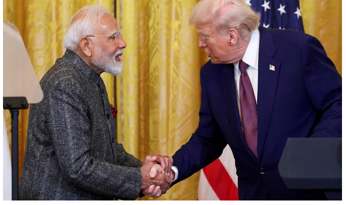
பாகிஸ்தான் மத்தியஸ்தம் செய்து, இதனால் 2 வார காலம் இடைக்கால போர் நிறுத்தம் அமலானது. இந்த போர் நிறுத்தம் 21-ம் தேதியுடன் முடிவாகி, அதற்குள் நிரந்தர போர் நிறுத்த ஒப்பந்தம் ஏற்பட பல்வேறு தரப்பினர் முயற்சியில் ஈடுபட்டுள்ளனர். அதன்படி, கடந்த சனிக்கிழமை பாகிஸ்தான் தலைநகர் இஸ்லாமாபாத்தில் அமெரிக்கா, ஈரான் இடையே பேச்சுவார்த்தை நடைபெற்றது. இது

புதுடெல்லி, ஏப்.16: பிரதமர் நிரேந்திர மோடியும் அமெரிக்க அதிபர் டொனால்டு ட்ரம்பும் நேற்று தொலைபேசியில் 40 நிமிடங்கள் முக்கிய ஆலோசனை நடத்தினர். அப்போது அமெரிக்கா - ஈரான் போர் குறித்தும், ஹார்முஸ் ஜலசந்தியைத் திறப்பது குறித்தும் இரு தலைவர்களும் முக்கிய ஆலோசனை நடத்தினர். கடந்த பிப்ரவரி 28-ம் தேதி ஈரான் மீது அமெரிக்கா மற்றும் இஸ்ரேல் இணைந்து தாக்குதல் நடத்தின. இதற்கு பதிலடி தரும் வகையில் வளைகுடாவில் உள்ள அமெரிக்காவின் நட்பு நாடுகள் மற்றும் இஸ்ரேல் மீது ஈரான் தாக்குதல் நடத்தியது. இந்த நிலையில் அமெரிக்கா மற்றும் ஈரான் இடையே போர் நிறுத்தம் செய்ய