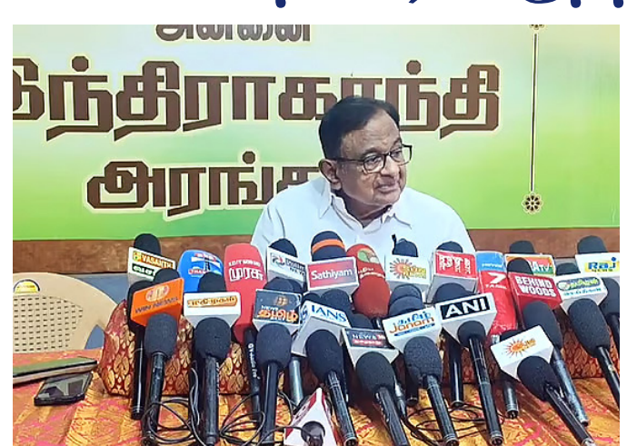
ப.சிதம்பரம் மத்திய அரசு முடிவுசெய்துள்ளது. மாநிலங்களுக்கு 815, யூனியன் பிரதேசங்களுக்கு 35: இந்தச் சட்டத்தின் அடிப்படையில், மாநிலங்களில் உள்ள மக்களவைத் தொகுதிகளில் 280 தொகுதிகள் மகனிக்கு ஒதுக்கப்படவுள்ளன. இரண்டு நாடாளுமன்றம் முன்மொழியும் சட்டத்தின் அடிப்படையில் 35 உறுப்பினர்களும் தேர்வு செய்யப்படவுள்ளனர். இத்துடன் 2011 மக்கள்தொகை கணக்கெடுப்பு அடிப்படையில் தொகுதிகளை மறுசீரமைப்பு செய்வதற்கான தொகுதி மறுசீரமைப்பு மசோதா மற்றும் சட்டப்பேரவைகளைக் கொண்ட டி.டி.வி, ஜம்மு-பெண்கள் மற்றும் புதுச்சேரி ஆகிய மூன்று யூனியன் பிரதேசங்களில் மகனிக்கு 33 சதவீத இடஒதுக்கீடு அளிக்க

புதுடெல்லி, ஏப்.16: தொகுதி மறுவரையறை என்பது கூட்டாட்சியின் சமநிலையை சீர்குலைக்கும் கொடுமான நடவடிக்கை என காங்கிரஸ் மூத்த தலைவரும் முன்னாள் மத்திய நிதியமைச்சருமான ப.சிதம்பரம் தெரிவித்துள்ளார். மக்களவை மற்றும் மாநில சட்டப்பேரவைகளில் மகனிக்கு 33 சதவீத இடஒதுக்கீடு அளிக்கும் 106-ஆவது அரசமைப்புச் சட்டம் திருத்தம் 2023-ஐ அமல்படுத்துவதற்கான சட்டப்பேரவை மசோதா ஏப்.16 முதல் ஏப்.18 வரை நடைபெறவுள்ள நாடாளுமன்றக் கூட்டத்தொடரில் அறிமுகமாகவுள்ளது. அப்போது மக்களவைத் தொகுதிகளின் எண்ணிக்கை 850 - ஆக அதிகரிக்கப்பட்டு அதில் 280 தொகுதிகள் மகனிக்கு ஒதுக்கப்படவுள்ளன. வரைவு மசோதாவின்படி, மக்களவை, மாநில சட்டப்பேரவைகளில் மகனிக்குள்ள தொகுதிகள் சுழற்சி முறையில் ஒதுக்கீடு செய்யப்படும். எனவே, 2011 மக்கள்தொகை கணக்கெடுப்பு தரவுகளின் அடிப்படையில் 2029-ஆம் ஆண்டு மக்களவை மற்றும் மாநிலங்களில் சட்டப்பேரவைகளில் சட்டப்பேரவைகளைக் கொண்ட டி.டி.வி, ஜம்மு-பெண்களுக்கு 33 சதவீத இடஒதுக்கீடு அளிக்கும் சட்டத்தை அமல்படுத்தும் நோக்கில் அரசமைப்புச்