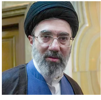
கூறியதாகக் கூறப்படும் செய்திகளை மட்டுமே ஈரான் அரசு ஊடகங்கள் வெளியிட்டு வருகின்றன. இதற்கிடையில், அயத்துல்லா காமேனியின் உடல் கோமில் அடக்கம் செய்யத் தயாராகி வருவதாக 'டைம்ஸ்' பத்திரிகையின்

லண்டன், ஏப்.8: ஈரானின் புதிய உச்ச தலைவர் மொஜ்தபா காமேனி, ஈரானின் கோம் நகரில் சுயநினைவற்ற நிலையில் மருத்துவ சிகிச்சை பெற்று வருகிறார் என ஒரு உள் வுத்துறை தகவலை மேற்கோள் காட்டி டைம்ஸ் யு.கே செய்தி நிறுவனம் தகவல் வெளியிட்டது. டைம்ஸ் யு.கே வின் செய்தியின்படி, அமெரிக்கா மற்றும் இஸ்ரேல், வளைகுடா நட்பு நாடுகளுடன் பகிர்த்து கொண்ட உள் வுத்துறை தகவல்களின் அடிப்படையில், மொஜ்தபா காமேனி சுயநினைவற்ற நிலையில் இருப்பதாகவும், அவருக்கு கோம் நகரில் தீவிர சிகிச்சை அளிக்கப்பட்டு வருவதாகவும் தெரிவிக்கப்பட்டுள்ளது. உச்ச தலைவர் மொஜ்தபா காமேனியின் இருப்பிடத்தை முதன்முறையாக வெளிப்படுத்தும் அந்த உள்வுத்துறை தகவல்கள் அறிந்ததாகவும் டைம்ஸ் யு.கே குறிப்பிட்டுள்ளது. மேலும், "ஈரான் ஆட்சியின் எந்தவொரு முடிவெடுக்கும் செயலிலும் அவரால் பங்கேற்க இயலாது" என டைம்ஸ் யு.கே செய்தி வெளியிட்டது. மேற்கு ஆசியாவில் மோதல் வெடித்ததிலிருந்து, மொஜ்தபா காமேனி எந்தவொரு பொதுவெளியிலும் தோன்றவில்லை. அவர் கூறியதாகக் கூறப்படும் செய்திகளை மட்டுமே ஈரான் அரசு ஊடகங்கள் வெளியிட்டு வருகின்றன. இதற்கிடையில், அயத்துல்லா காமேனியின் உடல் கோமில் அடக்கம் செய்யத் தயாராகி வருவதாக 'டைம்ஸ்' பத்திரிகையின் செய்தி குறிப்பிட்டுள்ளது. முன்னதாக, செவ்வாய்க்கிழமை இரவு 8:00 மணிக்குள் ஒப்பந்தத்தை எட்டுமாறு ஈரானுக்கு அமெரிக்க அதிபர் டொனால்ட் டிரம்ப் இறுதி எச்சரிக்கை விடுத்துள்ளார். இன்னும் மாளிகையில் நேற்று செய்தியாளர்களிடம் பேசிய டிரம்ப், "அவர்களுக்கு நாளை வரை அவகாசம் உள்ளது. இப்போது என்ன நடக்கிறது என்று பார்ப்போம். அதற்குப் பிறகு, அவர்களுக்குப் பாலங்கள் ஏதும் இருக்காது. மின் நிலையங்கள் ஏதும் இருக்காது. கற்காலம் போன்ற நிலைதான் இருக்கும்," என்று எச்சரித்தார்.