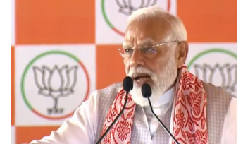
உள்ளூர்வாசிகள் பொருளாதார பலன்களை பெற முடியாமல் மோசடிக்கு ஆளானார்கள். இந்த நிலைமையை பா.ஜ.க. மாற்றி கொண்டிருக்கிறது. இந்த துறைகளில் எல்லாம் அசாம் தற்போது கயசார்புடன் உள்ளது. சொந்த இயற்கை வளங்களில் இருந்து மாநிலமும், அதன் மக்களும் நேரடி பலன்களை பெறுவது உறுதி செய்யப்பட்டு உள்ளது என்றார். நாட்டிலேயே அதிக ஊழல் செய்த கட்சியாக காங்கிரஸ் உள்ளது. காங்கிரசின் முதல் குடும்பம் நாட்டிலேயே அதிக ஊழல் செய்த குடும்பம் என்ற வாய்ப்புகளை உருவாக்கி வரும்போது, நாட்டின் சக்தி வாய்ந்த ஒன்றாக அசாம் உருமாற வேண்டும் என்று நாங்கள் ஈடுபாட்டுடன் ஆயிரக்கணக்கான கோடி மதிப்பிலான நில அபகரிப்பு குற்றச்சாட்டுகளை அவர்கள் எதிர்கொண்டு வருகின்றனர். உண்மையில் அவர்களே நில ஏ.டி.எம்.களை செயல்பட்டு கண்டுபிடிக்கப்பட்டபோது, சுத்திகரிப்பு மற்றும் தொழில் வளர்ச்சியானது மாநிலத்திற்கு வெளியே நடந்தது. இதனால்,

கவுகாத்தி, ஏப்.8: அசாம் மாநில சட்டசபைக்கு ஏப்ரல் 9-நேதி ஒரே கட்டத்தில் தேர்தல் நடத்தப்பட உள்ளது. இதற்கான வாக்கு எண்ணிக்கை மே 4-நேதி நடைபெறும். இந்த நிலையில், அசாமில் திபுருகார் நகரில் நடந்த அரசியல் பொதுக்கூட்டம் ஒன்றில் பிரதமர் மோடி கலந்து கொண்டு வாக்கு சேகரிப்பில் ஈடுபட்டார். அப்போது அவர் பேசும்போது, காங்கிரஸ் கட்சி ஊழல் கறை படிந்த கட்சி என்பது மட்டுமின்றி, வேலை செய்யவும் தயாராக இல்லை. இதன் விளைவாக, அசாமில் உள்ள ஒரு தலைமுறையினர் வேலைவாய்ப்பு எதுவும் இன்றி போராடி வருகின்றனர். ஆனால், பா.ஜ.க.-என்.டி.ஏ.வானது ஒற்றுமையான இணைந்து வேலைக்கான வாய்ப்புகளை உருவாக்கி வருகிறது. நாட்டின் சக்தி வாய்ந்த ஒன்றாக அசாம் உருமாற வேண்டும் என்று நாங்கள் ஈடுபாட்டுடன் ஆயிரக்கணக்கான கோடி மதிப்பிலான நில அபகரிப்பு குற்றச்சாட்டுகளை அவர்கள் எதிர்கொண்டு வருகின்றனர். உண்மையில் அவர்களே நில ஏ.டி.எம்.களை செயல்பட்டு கண்டுபிடிக்கப்பட்டபோது, சுத்திகரிப்பு மற்றும் தொழில் வளர்ச்சியானது மாநிலத்திற்கு வெளியே நடந்தது. இதனால்,