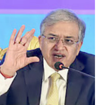
நோட்டீஸை மக்களவைத் தலைவர் (டூம் பிரலா) ஆய்வு செய்தார். தீவிர பரிசீலனைக்குப் பிறகு நோட்டீஸை ஏற்க மக்களவைத் தலைவர் மறுத்துவிட்டார். இவ்வாறு அறிக்கையில் தெரிவிக்கப்பட்டு உள்ளது. இதேபோல மாநிலங்களவைத் தலைவர் சி.பி.ராதா கிருஷ்ணமும் நோட்டீஸை ஏற்க மறுத்துவிட்டார்.

புதுடெல்லி, ஏப்.8: தலைமைத் தேர்தல் ஆணையர் குரானேஷ் குமாரை பதவி நீக்கம் செய்யக் கோரும் தீர்மானத்தைக் காண நோட்டீஸ் நாடாளுமன்றத்தின் இரு அவைகளிலும் கடந்த மார்ச் மாதம் சமர்ப்பிக்கப்பட்டது. எதிர்க்கட்சிகள் சமர்ப்பித்த இந்த நோட்டீஸில் மக்களவையின் 130 எம்பிக்கள், மாநிலங்களவையின் 63 எம்பிக்கள் கையெழுத்திட்டு இருந்தனர். இந்த சூழலில் மக்களவை, மாநிலங்களவையின் நோட்டீஸ் ரத்து செய்யப்பட்டு உள்ளது. இது குறித்து மக்களவை செயலாளர் உபதல் குமார் சிங் வெளியிட்ட அறிக்கையில் கூறியிருப்பதாவது: தலைமைத் தேர்தல் ஆணையரை பதவி நீக்கம் செய்யக் கோரி கடந்த மார்ச் 12ம் தேதி நோட்டீஸ் அளிக்கப்பட்டது. இந்த