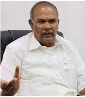
சொல்லி உள்ளது. எவ்வளவு சீக்கிரம் முடியுமோ, அதனை செய்து கொடுங்கள் என்றுதான் சொல்லி உள்ளார்கள்.

திருநெல்வேலி, நவ.22: “விஜய் மனதளவில் மிகவும் பாதிக்கப்பட்டுள்ளார். கோவை, மதுரை மெட்ரோ ரயில் திட்டங்கள் தொடர்பான விரிவான அறிக்கை அளித்துள்ள நிலையில், அவற்றுக்கு மத்திய அரசு ஒப்புதல் அளிக்க வேண்டும்” என்று தமிழக சட்டப் பேரவை தலைவர் மு.அப்பாவு தெரிவித்தார்.