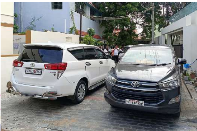
அதிகாரிகள் சோதனை நடத்தினர்.