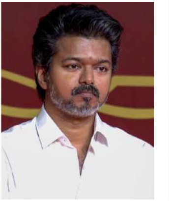
தருகிறார்கள். சென்னை 2-ம் கட்ட மெட்ரோ ரயில் திட்டத்திற்கு 6 ஆண்டுகள் எதையும் செய்யாமல் இருந்த சூழலில் தான், தமிழக அரசு 6-ல் 5 பங்கு நிதி ஒதுக்கீடு செய்து பணிகள் தற்போது நடைபெற்று வருகிறது. ஆனால் ஒரு பங்கு தொகையை மட்டும் கொடுத்துவிட்டு அனைத்தையும் தாங்கள் கொடுத்ததாக சொல்லி வருகிறார்கள்.

திருநெல்வேலியில் செய்தியாளர்களிடம் இன்று அவர் கூறியது: “இந்திய அரசியலமைப்புச் சட்டப்படி சட்டப் பேரவையில் நிறைவேற்றிய மசோதா குறித்து எவ்வளவு விரைவாக நடவடிக்கை எடுக்க வேண்டுமோ, அந்தளவுக்கு ஆளுநர் நடவடிக்கை எடுக்க வேண்டும். 2 ஆண்டு காலமாக மசோதாவை ஆளுநர் நலுவலையில் வைத்து வந்துள்ளார். கிடப்பில் போடப்படும் மசோதாவை நிறைவேற்ற காலநீரணயம் செய்ய வேண்டும் என்றும் ஆளுநர் விருப்புவெறுப்பு இல்லாமல் செயல்படவேண்டும் என்ற்தான் உச்ச நீதிமன்றத்தில் வழக்கு தொடரப்பட்டது. தமிழக அரசு உச்சநீதிமன்றத்தில் தொடர்ந்த வழக்கில் விளக்கத்தையே நீதிமன்றம் கொடுத்துள்ளது. வழக்குக்கு தீர்ப்பு கொடுக்கவில்லை.